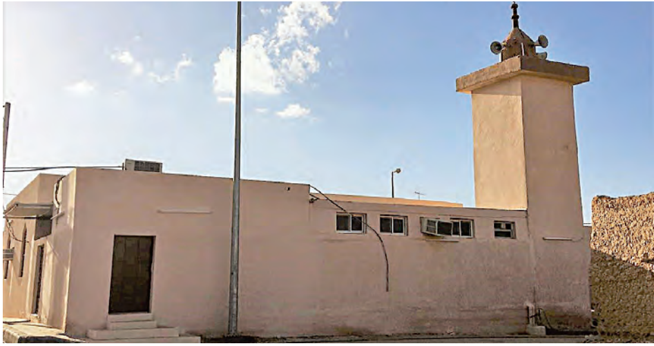
مسجد قرية الخيس بالمملكة العربية السعودية