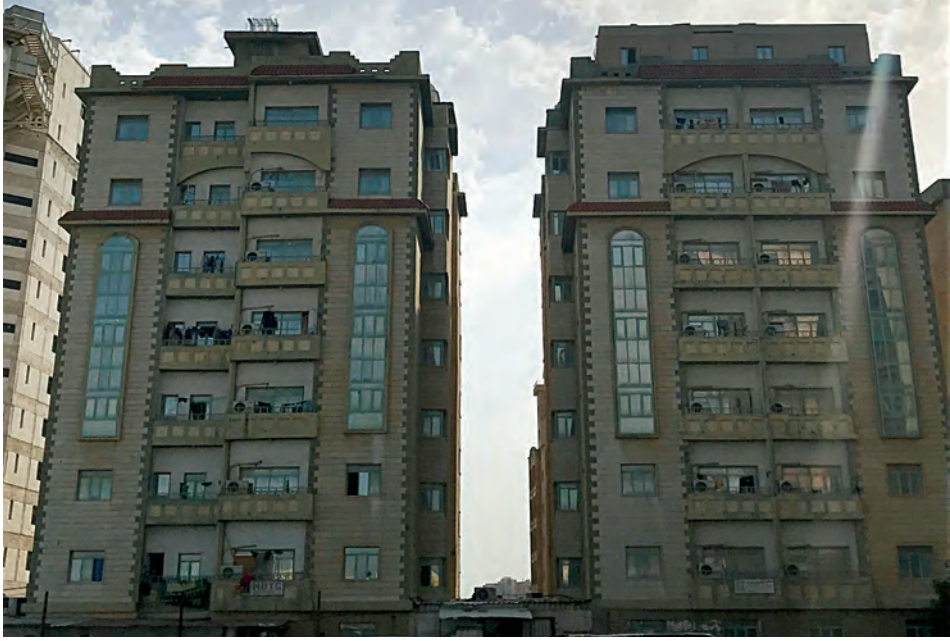
عقاران وقف لله تعالى في منطقة المنقف