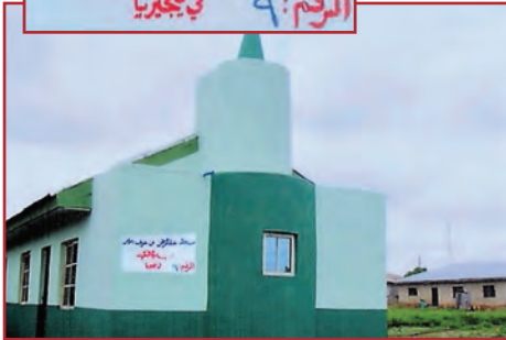
مسجد عبدالرحمن بن عوف رضي الله عنه مدونة الكويت الرقم: ٩ في نيجيريا