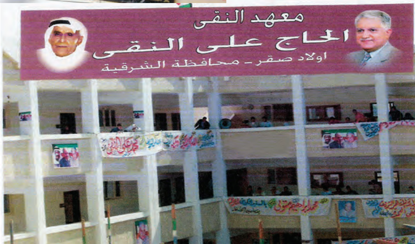
معهد علي النقي في أولاد صقر بالشرقية