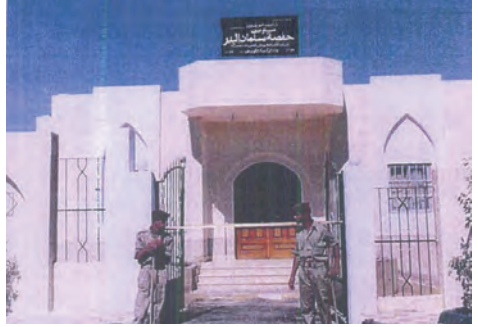
صور من مشروع مجمع حفصة سلمان البدر بمصر