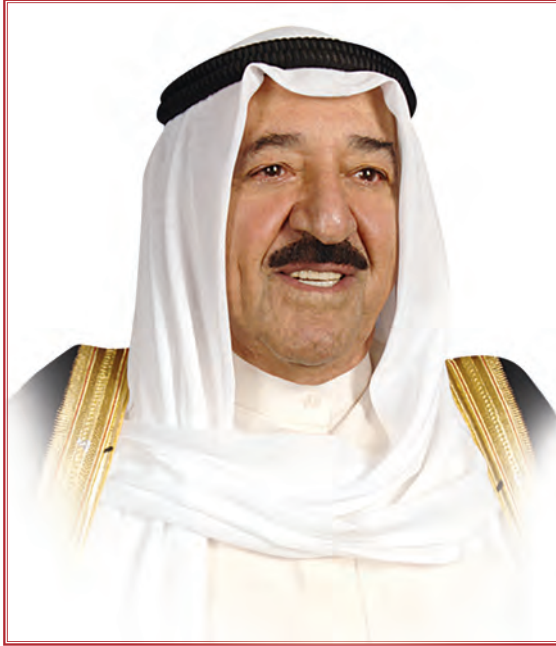
صاحب السمو الشيخ أحمد الجابر الصباح أمير دولة الكويت