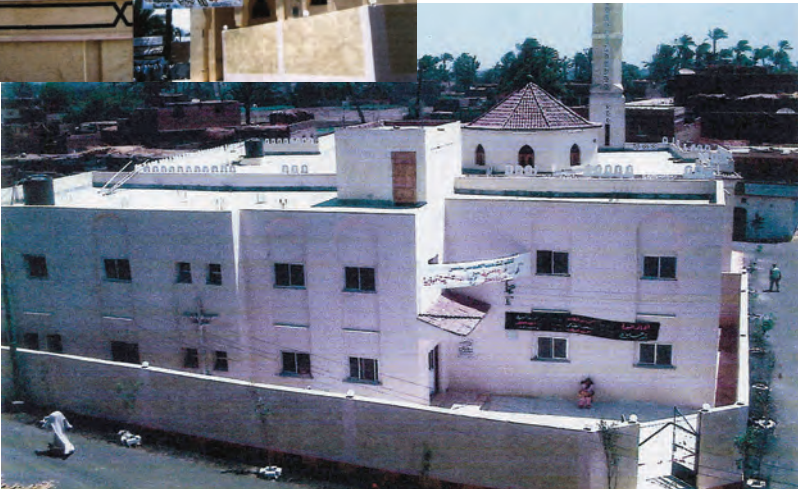
مجمع النقي الخيري الإسلامي بسوهاج