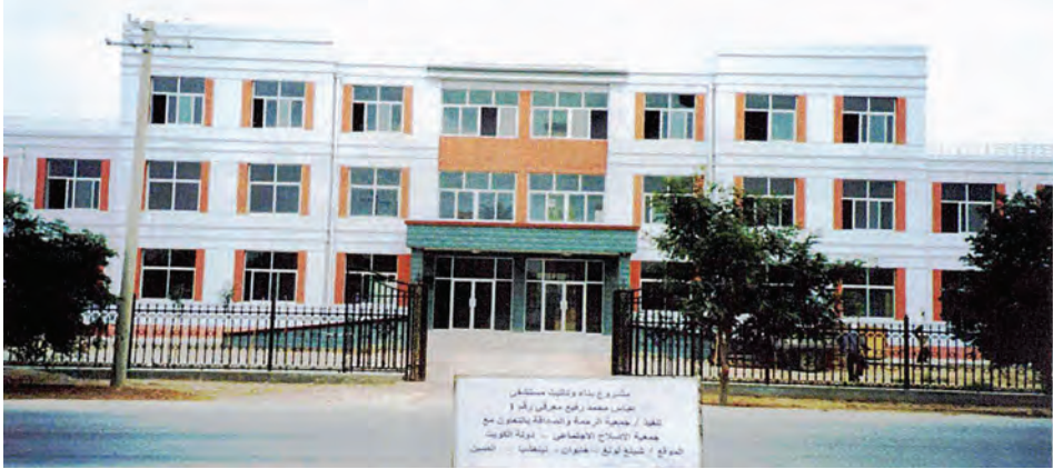
مستشفى أ.د. عباس معرفي (١) في نينغشيا - الصين

٤- مستشفى عباس محمد رفيع معرفي ووالديه في يتنشان - نينغشيا - الصين - المساحة: ٢١٢٠٠م بتكلفة قدرها ٣٦٦٥٠ د.ك.