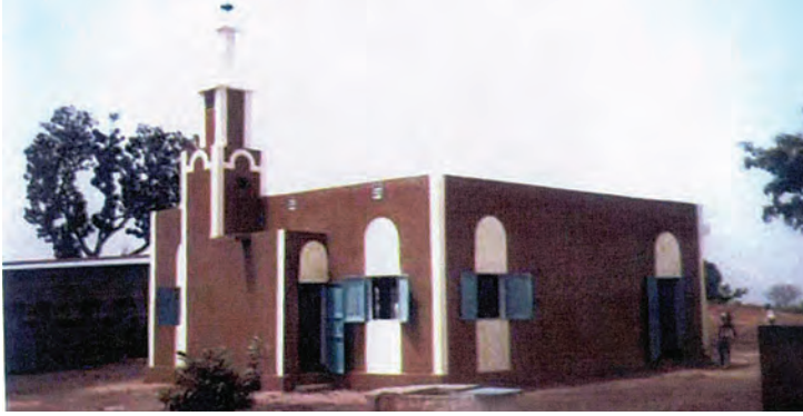
مسجد في سيراليون