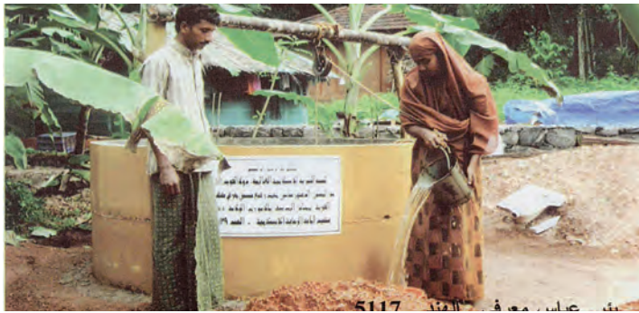
بئر في الهند