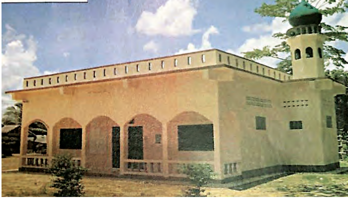
مسجد أ.د. عباس محمد رفيع معرفي رقم ٤٥٥٧ في الصين - تنفيذ الرحمة العالمية - الكويت

٢- مسجد عباس محمد رفيع معرفي - مشروع رقم ٤٥٥٧ - في الصين.