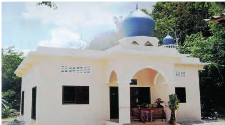
مسجد في ستول - تايلاند

٨- مسجد محمد رفيع حسين معرفي - مشروع رقم - مشروع رقم ١٤٦٩٦ - في تشاد - بتكلفة قدرها ١٥٧٥٠ د.ك. ٩ - مسجد عباس محمد رفيع معرفي في سيراليون.