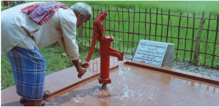
بئر في نيبال