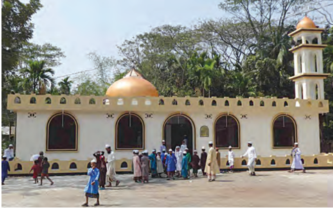
لقطة خارجية للمسجد