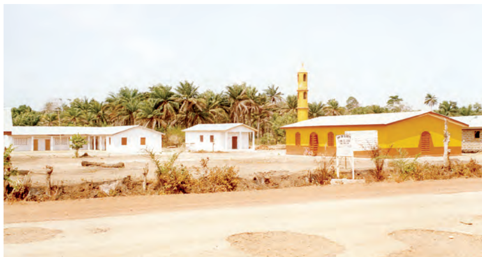
مدرسة أ.د. عباس معرفي في سيراليون - إفريقيا

- وأنشأ مدرسة ومكتبة في سيراليون بإفريقيا.