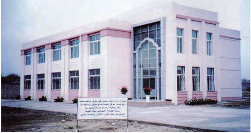
مدرسة أ.د. عباس معرفي في نينغشيا - الصين