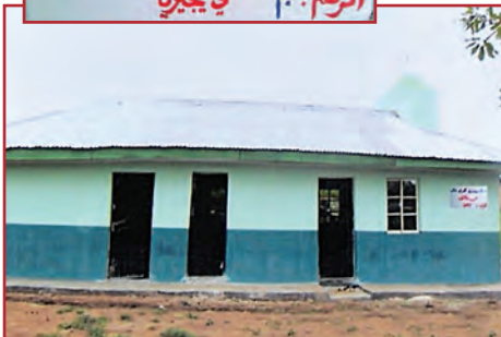
مسجد سعيد بن زيد القرشي رضي الله عنه مدونة الكويت الرقم: ١٠ في نيجيريا