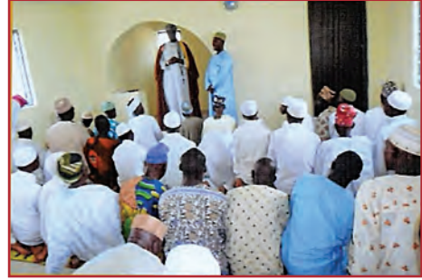
٨- مسجد طلحة بن عبيد الله رضي الله عنه.