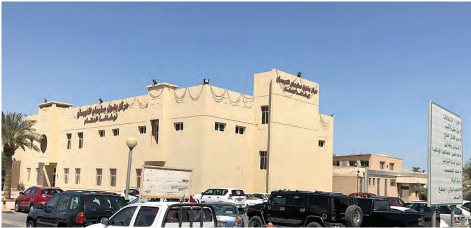
مركز بتول العيبان لهشاشة العظام في منطقة الصباح الصحية بالشويخ قرب مستشفى الولادة