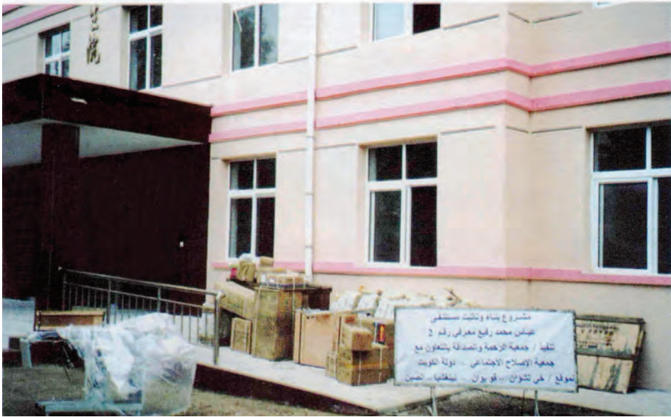
مستشفى أ.د. عباس معرفي (٢) في نينغشيا - الصين

٢- مشروع بناء وتأثيث مستشفى عباس محمد رفيع معرفي رقم (٢)، في حي تشوان بقويوان في مقاطعة نينغشيا، وتبلغ مساحتها ٢م١٦٠٠، بتكلفة قدرها ٣٢٥٠٠ د.ك، وتنفيذ جمعية الرحمة والصدقة، بالتعاون مع جمعية الإصلاح الاجتماعي في الكويت.