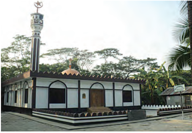
لقطة خارجية للمسجد