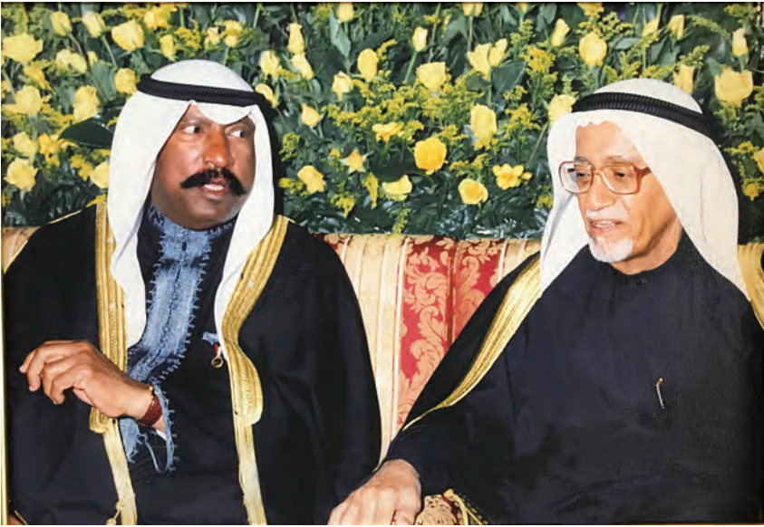
المحسن مع الأمير الوالد الشيخ سعد العبدالله السالم الصباح رحمهما الله