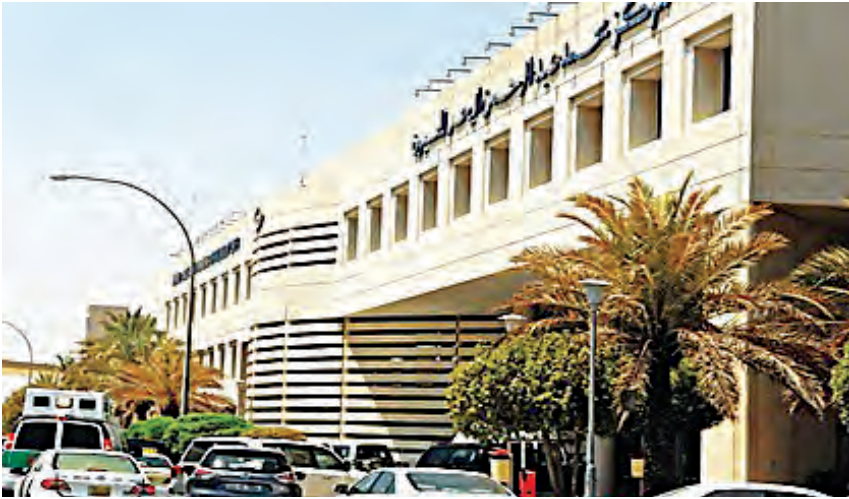
مركز محمد عبدالرحمن البحر للعيون

لم يخفَ على المحسن محمد بن عبدالرحمن البحر رحمه الله، ما للخدمات الصحية من أهمية قصوى للمجتمع، ولذلك كان له العديد من المساهمات الصحية في الكويت وخارجها، فقد تبرع رحمه الله بمبلغ ٣,٥٠٠,٠٠٠ د.ك (ثلاثة ملايين ونصف مليون دينار)، لبناء مركز البحر لجراحة العيون، الذي يقع في منطقة الصباح الطبية التخصصية، وقد تم ربطه إنشائياً وإدارياً وفنياً بمستشفى ابن سينا، ويتكون المركز من ثلاثة أدوار، وتبلغ مساحته الإجمالية: ٢١٠٠٠٠ (عشرة آلاف متر مربع)، وتقدر الطاقة الاستيعابية له: ٩٠٠ سرير، و ٥ غرف عمليات، وقاعة محاضرات كبيرة مزودة بشاشات متصلة بغرف العمليات، وتم افتتاحه في ٨ مايو ١٩٩٩م.