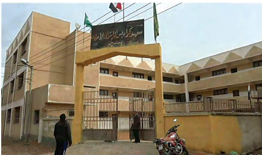
الواجهة الرئيسة للمعهد