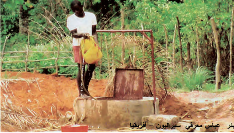
بئر عباس معرفي سيراليون - أفريقيا

١٠ - بئر عباس محمد رفيع معرفي - في دولة سيراليون، بالقارة الإفريقية.