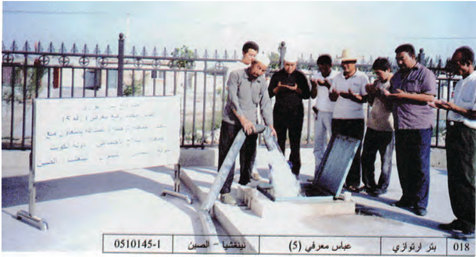
بئر ارتوازي في مقاطعة نينغشيا - الصين