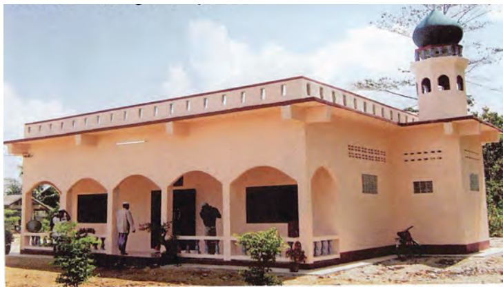
مسجد في وناج شارينرات - تايلاند

٧- مسجد عباس محمد رفيع ووالديه - مشروع رقم ١٠٠٠١٧٣٨٣ - تواج شارينرات - تونجوا - ستول - في مملكة تايلاند - ٢١٢٠م بتكلفة قدرها ٥٣٠٠ د.ك.