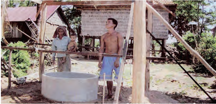
بئر في كمبوديا