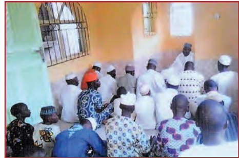
٩- مسجد عبدالرحمن بن عوف رضي الله عنه.