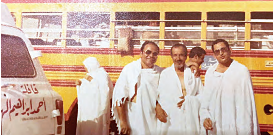
صورة قديمة لإحدى رحلات حملة الهدان لنقل الحجاج بواسطة السيارات

وفي أواخر الخمسينيات أسس حملة كبيرة لنقل الحجاج بواسطة السيارات - وكانت تعرف باسم «حملة الهدان» - حيث أحب هذه المهنة، رغبة في خدمة الناس؛ ابتغاء مرضاة الله، ومشاركةً في خدمة حجاج بيت الله الحرام. واستمر في هذا المجال حتى أوائل الثمانينيات من القرن الماضي.