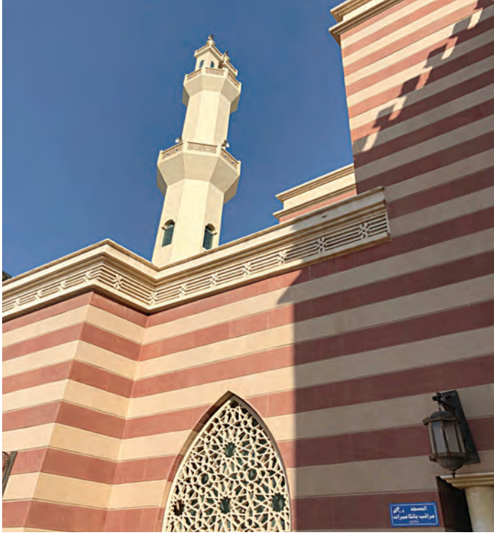
مسجد محمد عبد الرحمن البحر بمنطقة السرة