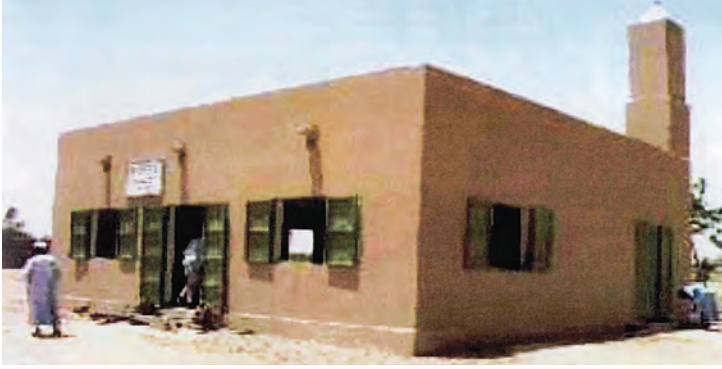
مسجد في سيراليون

١٠- مسجد عباس محمد رفيع معرفي في خابلو بجمهورية باكستان - رقم المشروع ٤٩٥ .