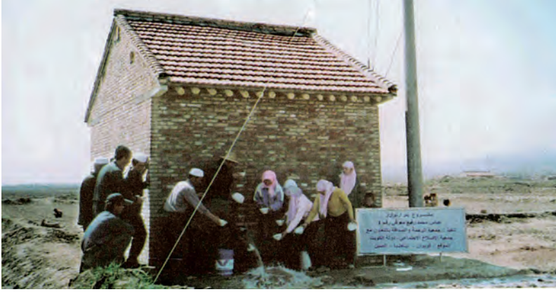
بئر إرتوازي نينغشيا - الصين