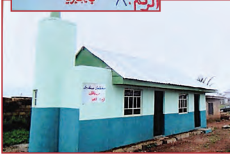
مسجد طلحة بن عبيد الله رضي الله عنه مدونة الكويت الرقم: ٨ في نيجيريا