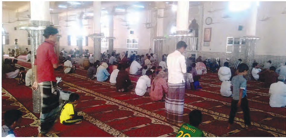
المسجد من الداخل