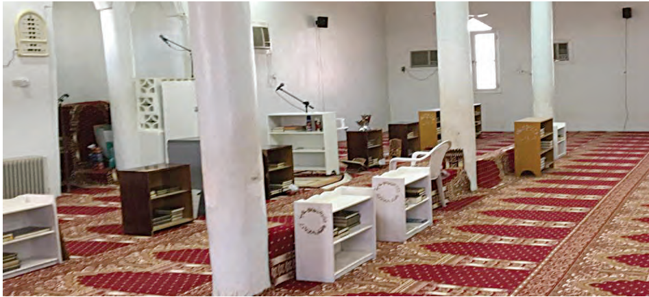
المسجد من الداخل