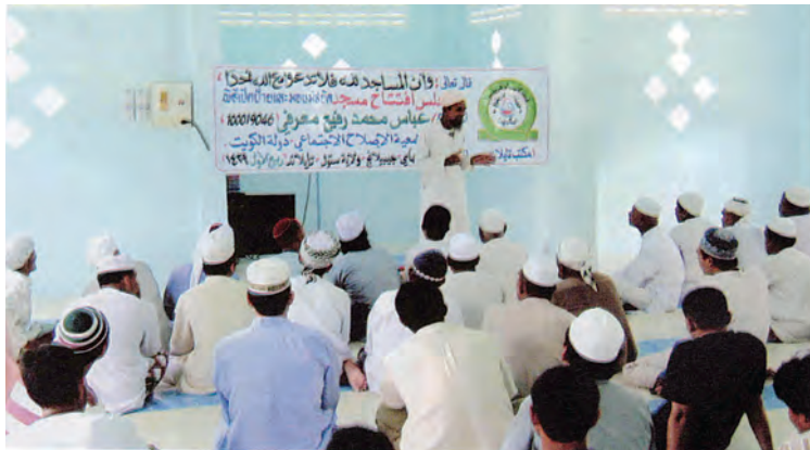
مسجد في ولاية - ستول - تايلاند