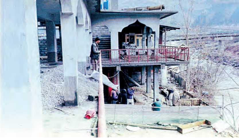
جانب من مسجد علي العتال في باكستان

وتم تأسيس المسجد في ٢٩/٤/١٩٨٧م، ويضم مصلى للرجال وآخر للنساء ومئذنة ومكتبة ومنزلاً للإمام، كما تم بناء سور للمسجد وعمل مياضئ ودورات مياه، وتحمل تكاليف إمام وخطيب متفرغ.