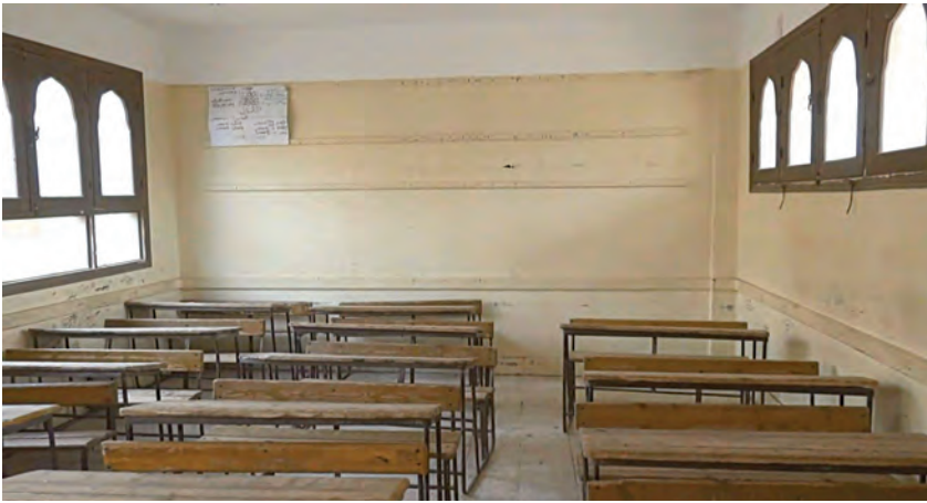
أحد فصول المعهد