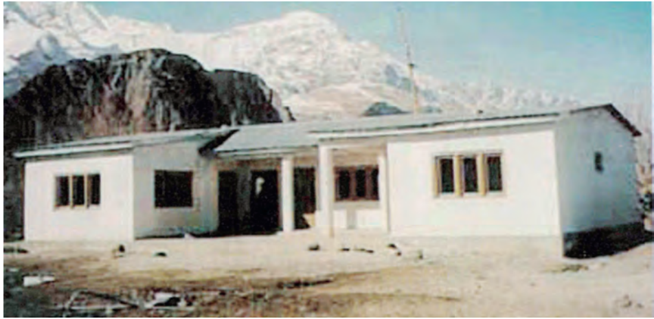
مدرسة أ.د. عباس معرفي للبنات في سكرودو - باكستان