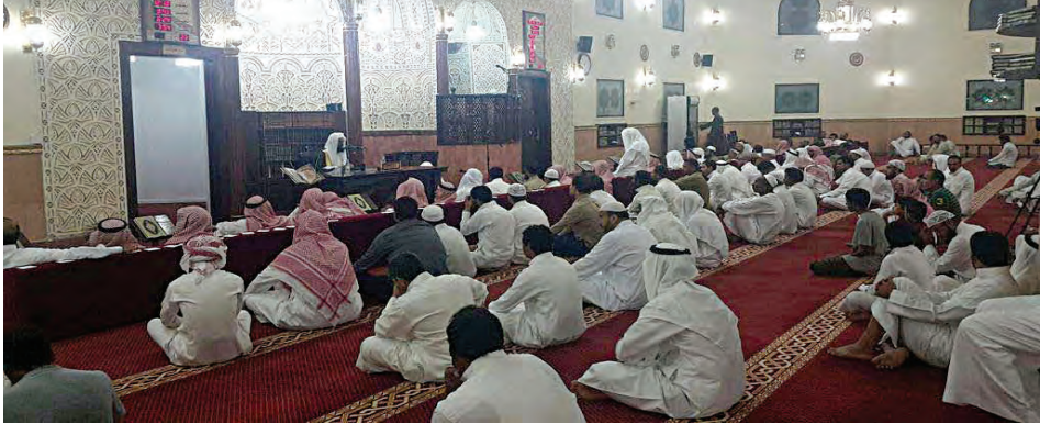
أحد الدروس الدينية في مسجد البراء بن مالك بقطعة (٤) في منطقة الصباحية