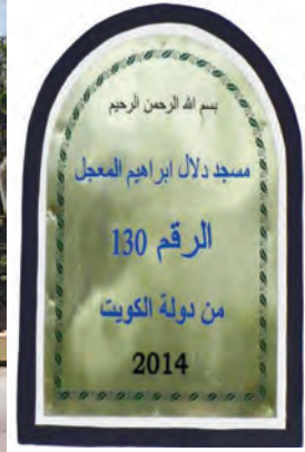
اللوحة النحاسية في مدخل المسجد