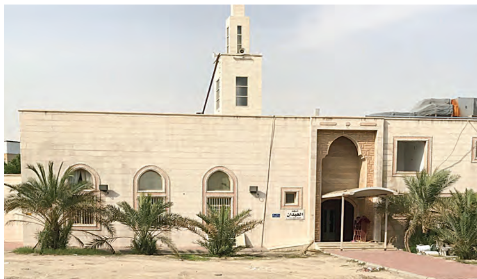
مسجد الهدان بالفحيجيل ق ٣