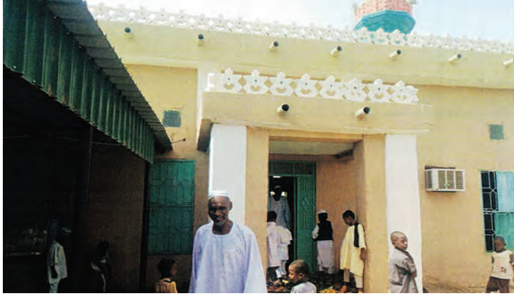
مسجد علي الغتال في السودان