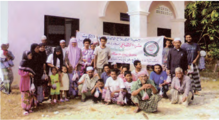
مشروع الأضاحي في تايلاند

مشروع ذبح الأضاحي، بمسجد د. عباس محمد رفيع معرفي (رقم ١)، في تايلاند بإشراف وتنفيذ جمعية الإصلاح الاجتماعي بدولة الكويت - لجنة آسيا وإفريقيا.