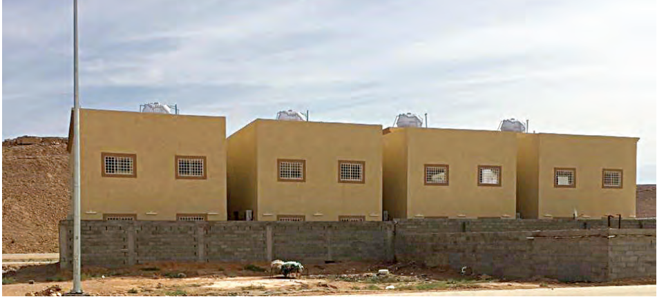
صور المساكن الثمانية التي تم بناؤها في إحدى المناطق بالسعودية