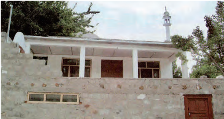
مسجد في خابلو - سكرودو - الباكستان

١٠- مسجد عباس محمد رفيع معرفي في خابلو بجمهورية باكستان - رقم المشروع ٤٩٥ .