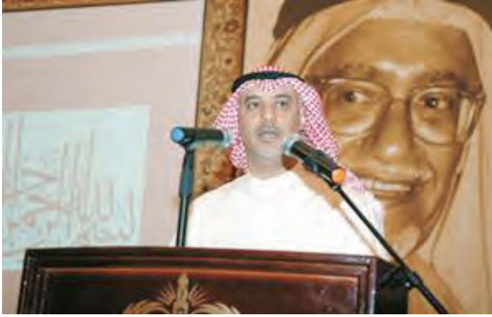
إحدى فعاليات مسابقة الصانع للقرآن الكريم