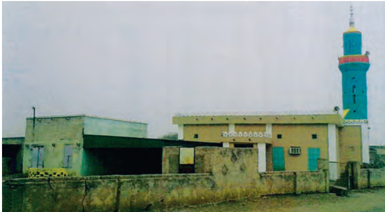
مسجد علي العتال بولاية سنار، في السودان