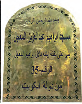
اللوحة النحاسية في مدخل المسجد