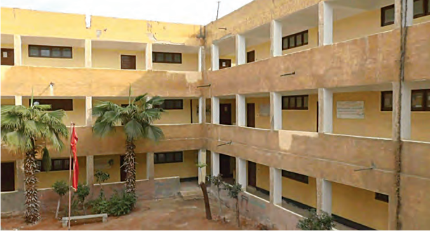
المعهد من الداخل