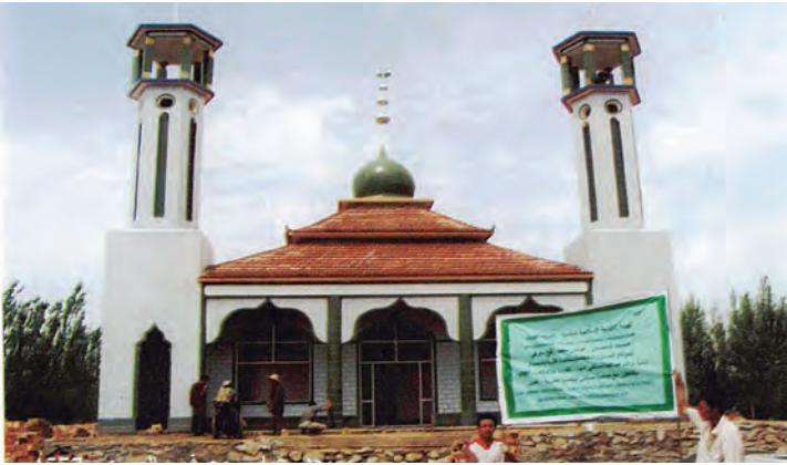
مسجد عباس محمد رفيع معرفي رقم ٤٥٥٧ في الصين - تنفيذ الهيئة الخيرية الإسلامية العالمية

٣- مسجد عباس محمد رفيع معرفي - مشروع رقم ٤٥٥٧ - في الصين.