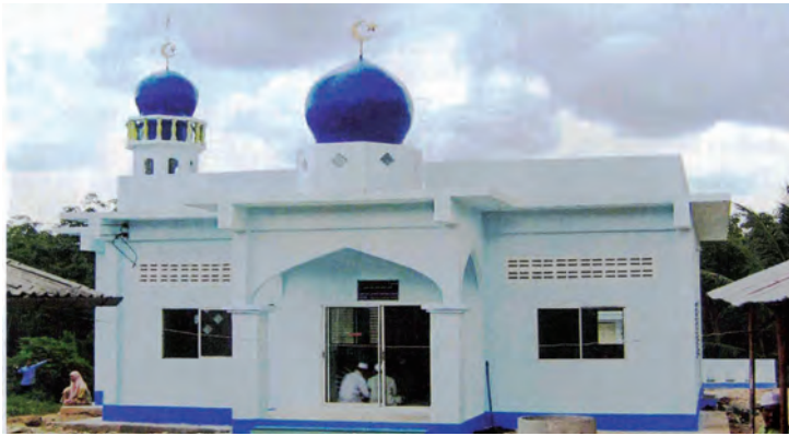
مسجد في مدينة باتيه تهاي - تايلاند

٦- مسجد عباس محمد رفيع معرفي، بمنطقة باتيه تهاي في جيبي لانج في ولاية ستول بمملكة تايلاند، وهو مشروع رقم ١٩٠٤٦/١٠٠٠، وتبلغ مساحة المسجد ١٠٠ م ٢ ، بتكلفة قدرها ٤٥٠٠ د.ك، وقام بتنفيذ المشروع مكتب تايلاند بالتعاون مع جمعية الإصلاح الاجتماعي بدولة الكويت، وتم افتتاحه في شهر ربيع الأول عام ١٤٢٩هـ.