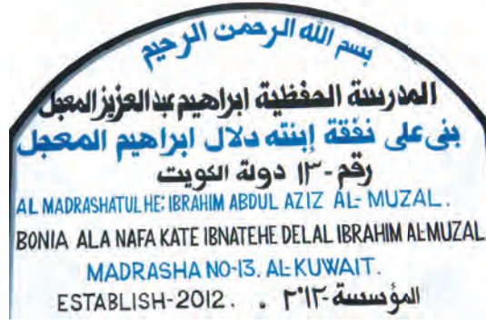
اللوحه الرئيسية أعلى المدرسة

أما المدرسة الثانية - والتي تأسست بفضل الله على نفقة