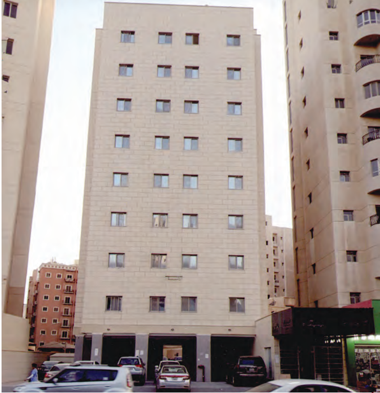
وفاتها: صورة عمارة «الحببية» الوقفية في شارع بغداد بمنطقة السالمية

ثلاث: صدقة جارية أو علم ينتفع به، أو ولد صالح يدعو له» (١) .