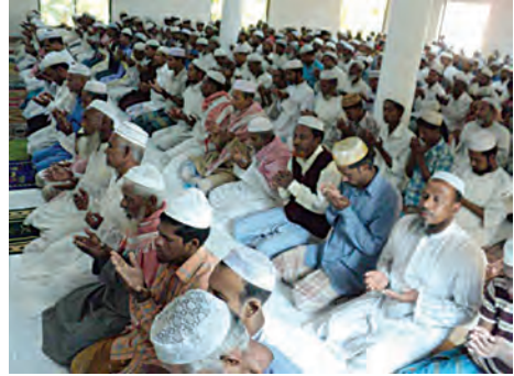
اكتظاظ المسجد بالمصلين داخله وخارجه