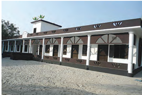
مدرسة إبراهيم عبدالعزيز المعجل الحفظية