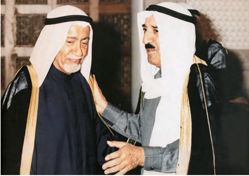
لقطة معبرة تجمع بين سمو الأمير الشيخ صباح وصاحب السيرة.. وتعكس العلاقة الطيبة بينهما

وساهم رحمه الله في تأسيس وعضوية مجالس وإدارات مؤسسات اقتصادية كويتية كبرى، ولكنه استقال منها بعد نجاحه في انتخابات مجلس الأمة في يناير ١٩٧٥ طبقاً للائحة المجلس.