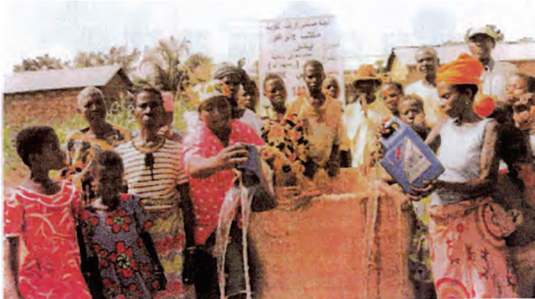
بئر في سيراليون