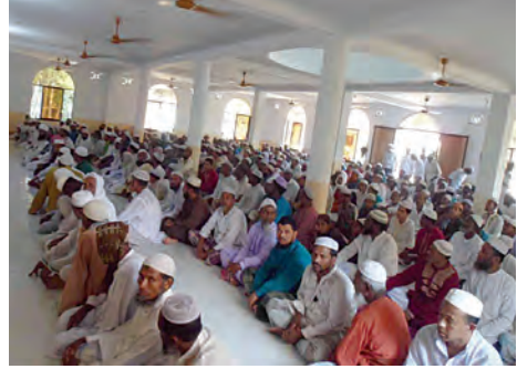
جموع المصلين في افتتاح المسجد

إن أهمية التعليم تماثل أهمية الماء والهواء دون مبالغة، فإن كانت تلك العناصر المادية هي ما تبقى الإنسان حياً، فإن التعليم يجعله قادراً على الإبداع ويجعله أكثر فاعلية، ويزيد من قدرته على إعمار الأرض وتتمية مجتمعه. وبالعلم والمال تبني الدول مجدها، وتشيد ببيان حضارته، وتتبوأ المكانة اللائقة بها بين أمم الأرض. قال الشاعر: