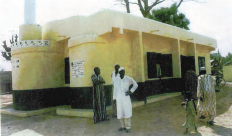
مسجد في غانا

١- مسجد عباس محمد رفيع معرفي - مشروع رقم ٤٥١٣ - في غانا