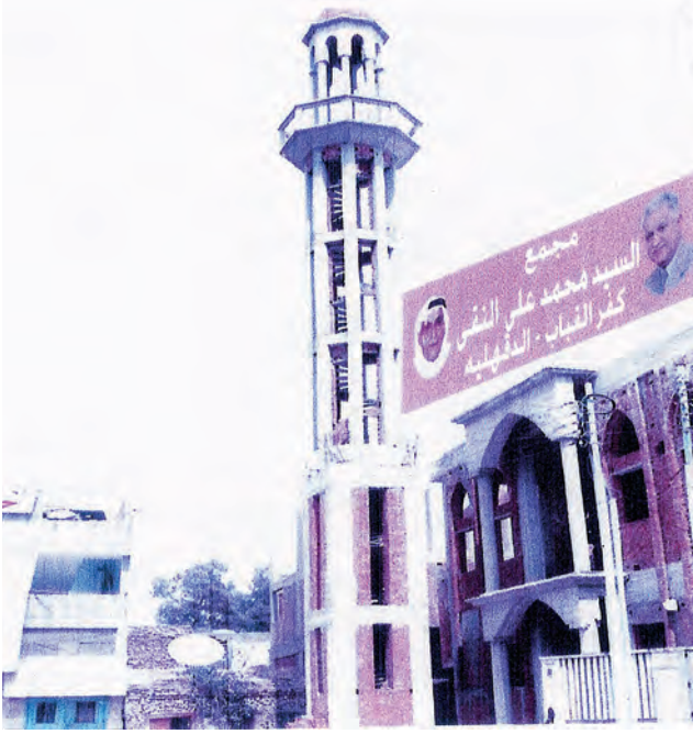
مجمع النقي الإسلامي الخيري بمحافظة الدقهلية

وفي عام ٢٠٠٨ وفي ظل استمرار مسيرة الخير، تم الاتفاق على إنشاء مجمع النقي الإسلامي الخيري بكفر القباب بمدينة المنصورة بمحافظة الدقهلية بموقع متميز على الطريق العام الذي يربط مدينة المنصورة بدمياط، ويشمل مسجداً وداراً للمناسبات، ويخدم ما يزيد على عشرين ألف