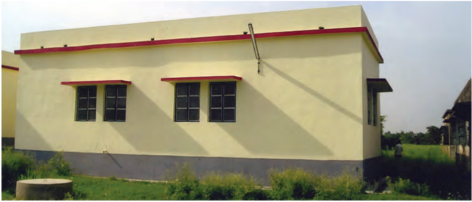
نماذج من المستوصفات التي بناها أ.د. عباس معرفي في الهند

كما أسهم في تأسيس مستوصفين في سيراليون ومستوصف في الهند ، باسمه مشروع رقم ٥٠٢٠.ب.