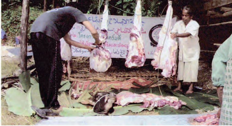
مشروع الأضاحي في تايلاند