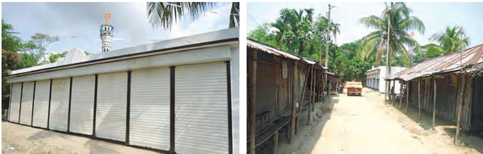
صور متعددة للمحلات الوقفية المتنوعة التي أسستها المحسنة دلال إبراهيم المعجل لتخدم المدرستين والمسجدين