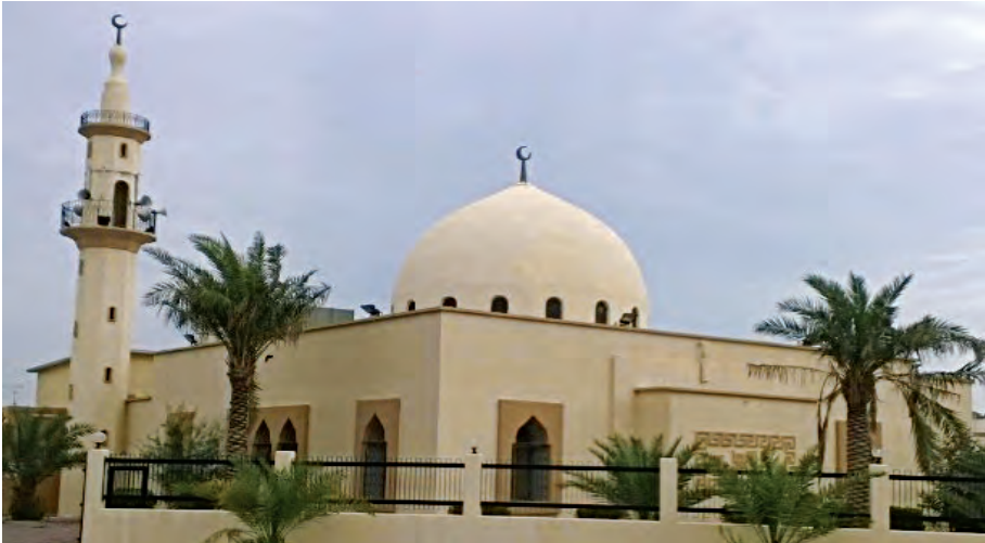
مسجد سعيد بن زيد بالقطعة (٢) في منطقة الأحمدية

واستجابة لأمر الله بالتعاون على البر والتقوى، في قوله تعالى: (وَتَعَاوَنُوا عَلَى الْبِرِّ وَالتَّقْوَىٰ) (المائدة: ٢) أسهم رحمه الله في بناء مسجد سعيد بن زيد بمنطقة الأحمدية في القطعة رقم ٢، وذلك عام ٢٠٠٠م. ويتسع الجامع لحوالي ٥٠٠ مصلياً، وتشرف عليه وزاره الأوقاف بدولة الكويت ويوجد به مصلى نساء.