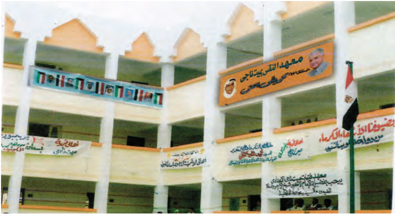
معهد النقي الأزهرى بقرية ميت ناجي في محافظة الدقهلية

يتكون الدور الأول من مصلى وخمسة فصول دراسية وحجرة شيخ المعهد وحجرتين للمدرسين ومعمل ومكتبة وحجرة إدارة وثلاث دورات مياه خاصة بالمدرسين ودورات مياه عامة للطلبة.