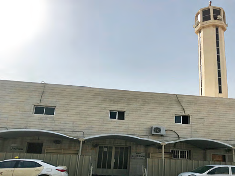
مسجد الصحابي الجليل أبي لبابة الأنصاري (الهدان) في منطقة الفحيحيل

وقد تم تأسيس هذا المسجد بشوارع المنقف، في منطقة الفحيحيل، بالقطعة رقم ٣، وبلغت تكلفته إنشائه خمسة وسبعين ألف دينار (٧٥٠٠٠ ألف دينار).