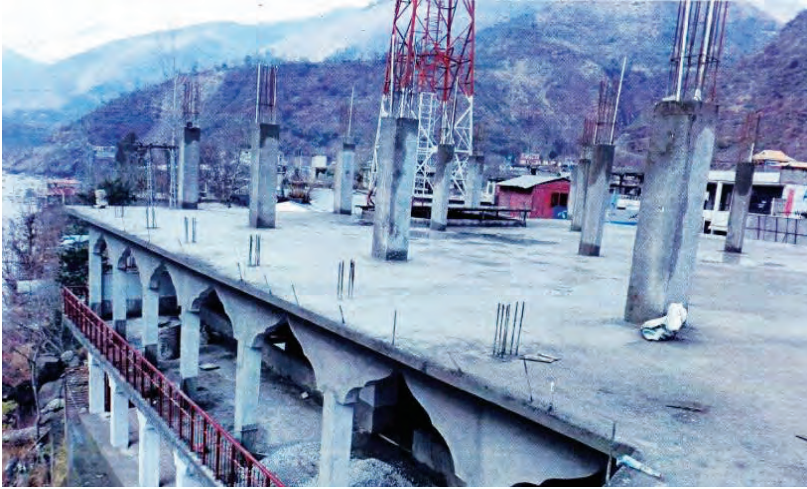
مسجد علي الغتال في باكستان - مرحلة التأسيس

أسس المحسن علي محمد عيسى الغتال رحمه الله مسجداً في جمهورية باكستان بواسطة جمعية إحياء التراث الإسلامي (لجنة زكاة قرطبة)، وذلك في مدينة مظفر آباد نصير آباد بولاية كشمير الباكستانية، وتم تنفيذ المشروع بواسطة جمعية أهل الحديث في كشمير بجمهورية باكستان، بتكلفة قدرها ١٠,٠٠٠ د.ك (عشرة آلاف دينار كويتي).